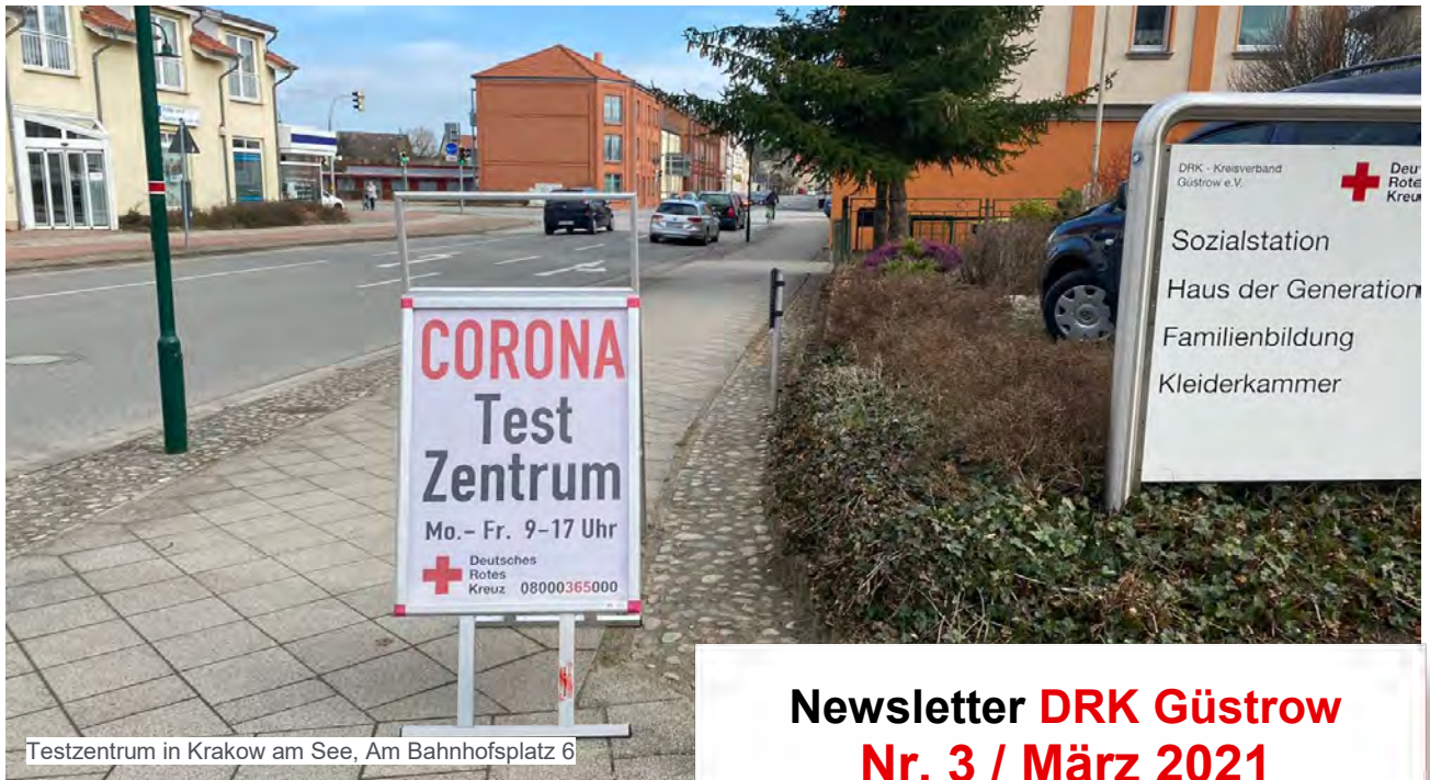
Testzentrum in Krakow am See, Am Bahnhofplatz 6