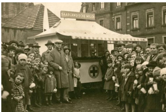
Ausgabe von Milch an Bedürftige durch das DRK: Stand des DRK in Saarbrücken, umringt von Bevölkerung - 1920er Jahre

Der Deutsche Rote Kreuz e.V. – der Dachverband von 19 DRK-Landesverbänden und dem Verband der Schwesternschaften vom DRK – feiert in diesem Jahr sein 100jähriges Bestehen. Am 25. Januar 1921 entsteht das Deutsche Rote Kreuz, wie wir es heute kennen: Die bestehenden deutschen Rotkreuzlandesvereine schließen sich auf einer Sitzung im Alten Rathaus in Bamberg in einem Dachverband zusammen, der das gesamte Rote Kreuz in ganz Deutschland vertritt.