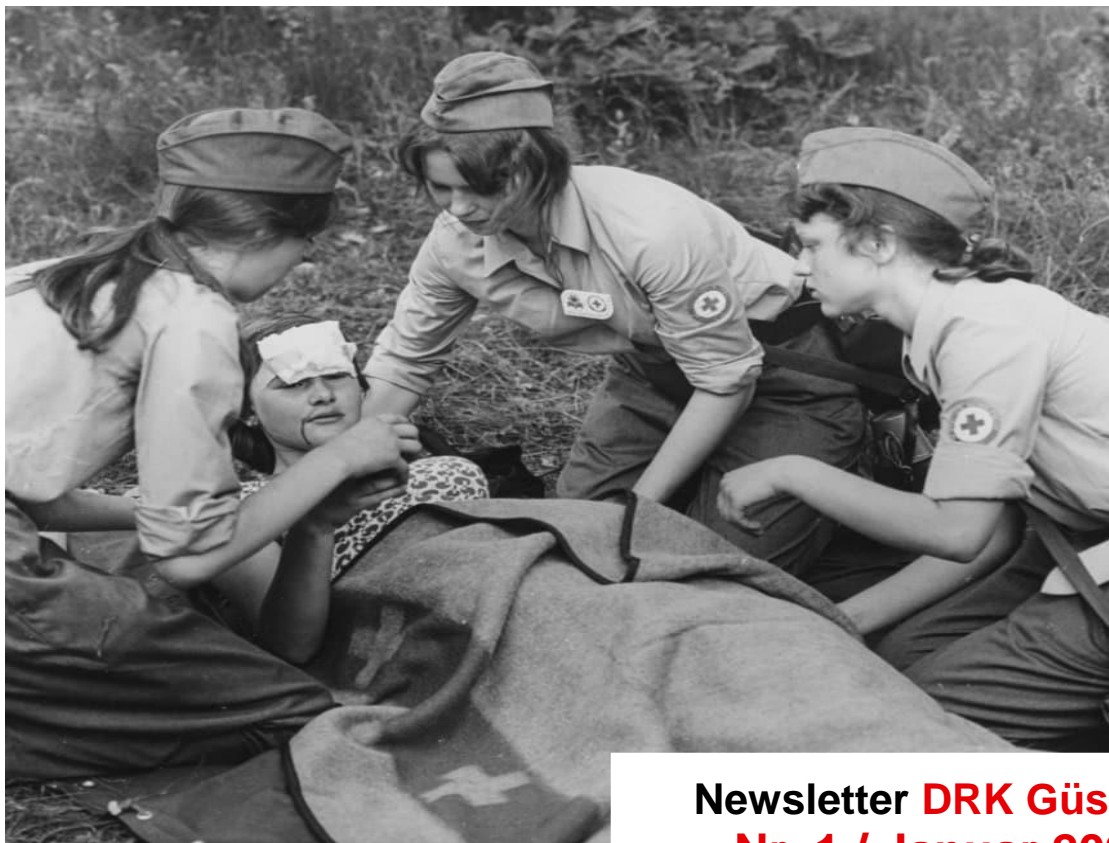
100 Jahre DRK